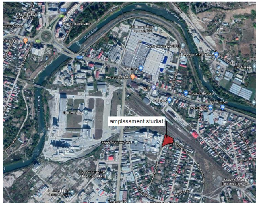
PLAN DE INCADRARE IN LOCALITATE